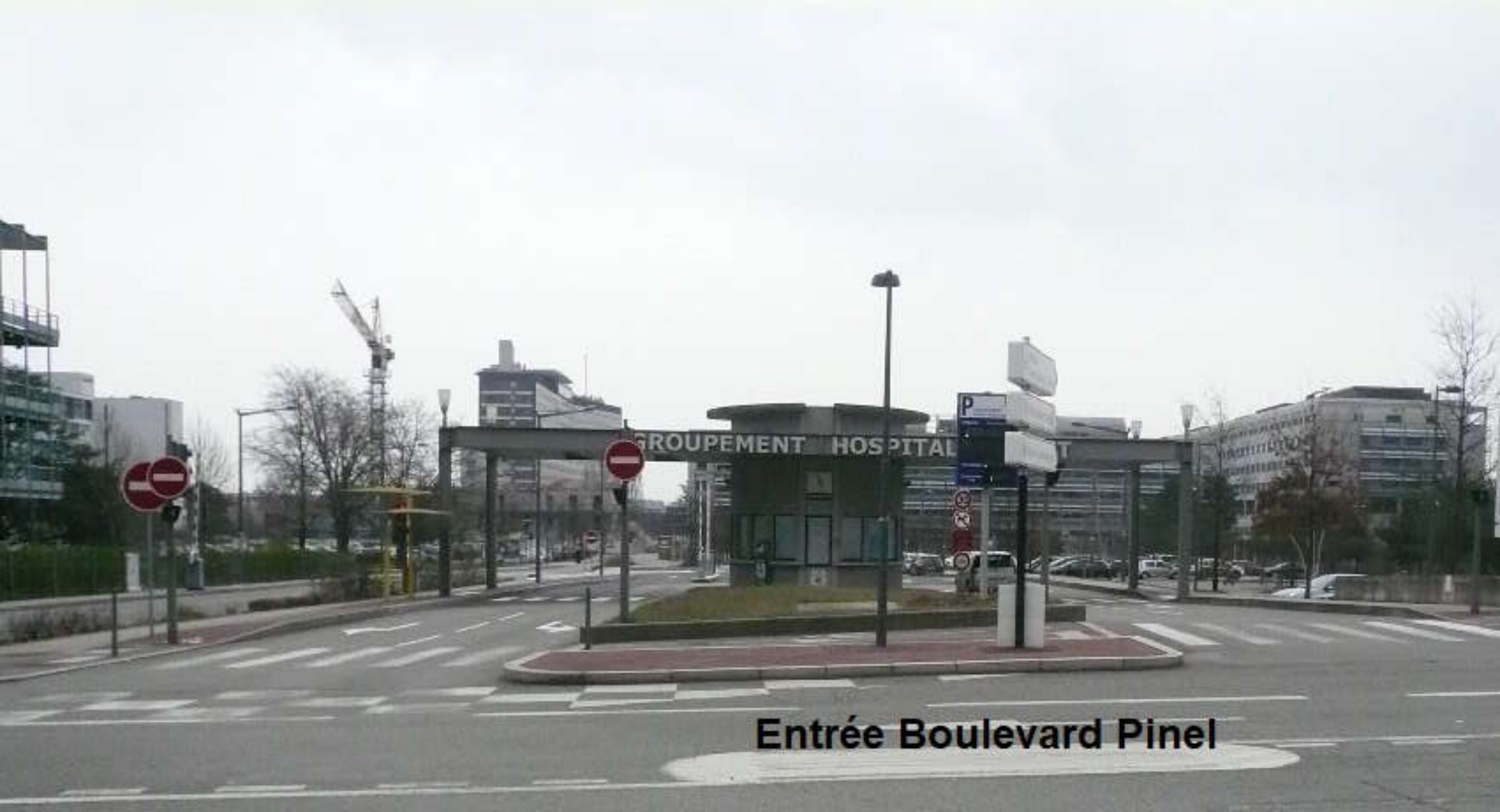
Entrée Boulevard Pinel